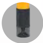
Cappuccio di protezione

Tavoli di saldatura 3D di DEMMELER. Attrezzati al meglio.