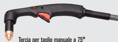
Torcia per taglio manuale a 75°

(per un numero maggiore di opzioni di torcia, consultare il sito Web www.hypertherm.com )