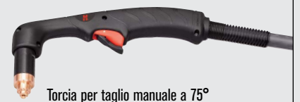
Torcia per taglio manuale a 75°

Stili di torce Duramax standard (per un numero maggiore di opzioni di torcia, consultare il sito Web www.hypertherm.com )