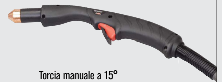
Torcia manuale a 15°